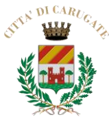
città di Carugate

con la collaborazione ed il sostegno di: