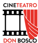
CineTeatro Don Bosco